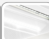
Εσωτερικός φωτισμός LED