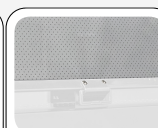
Κουρτίνα νυχτός (Υφασμα – Γκρι χρώμα)